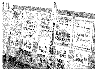
【資料8】分科会への案内板