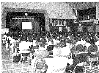
【資料7】全P集会の様子

子どもたちに負けないよう、我々大人も「学び合い、高め合う」学校文化を築き上げていこうと呼びかけた。全保護者を対象にし、5つの分科会を設け、学習会を開催した。学級懇談会と連動させ、懇談会のすぐ後に実施することで参会率も向上していった。