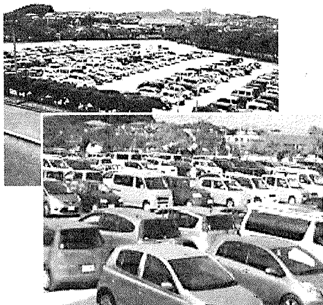
【資料 2】学校開放日駐車場の様子