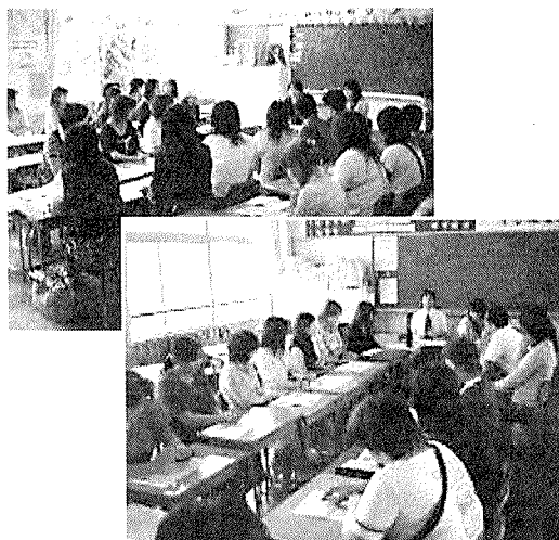
【資料 3】学級懇談会の様子